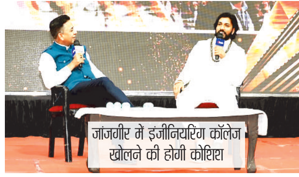
जंगगीर में इंजीनियरिंग कॉलेज खोलने की होगी कोशिश