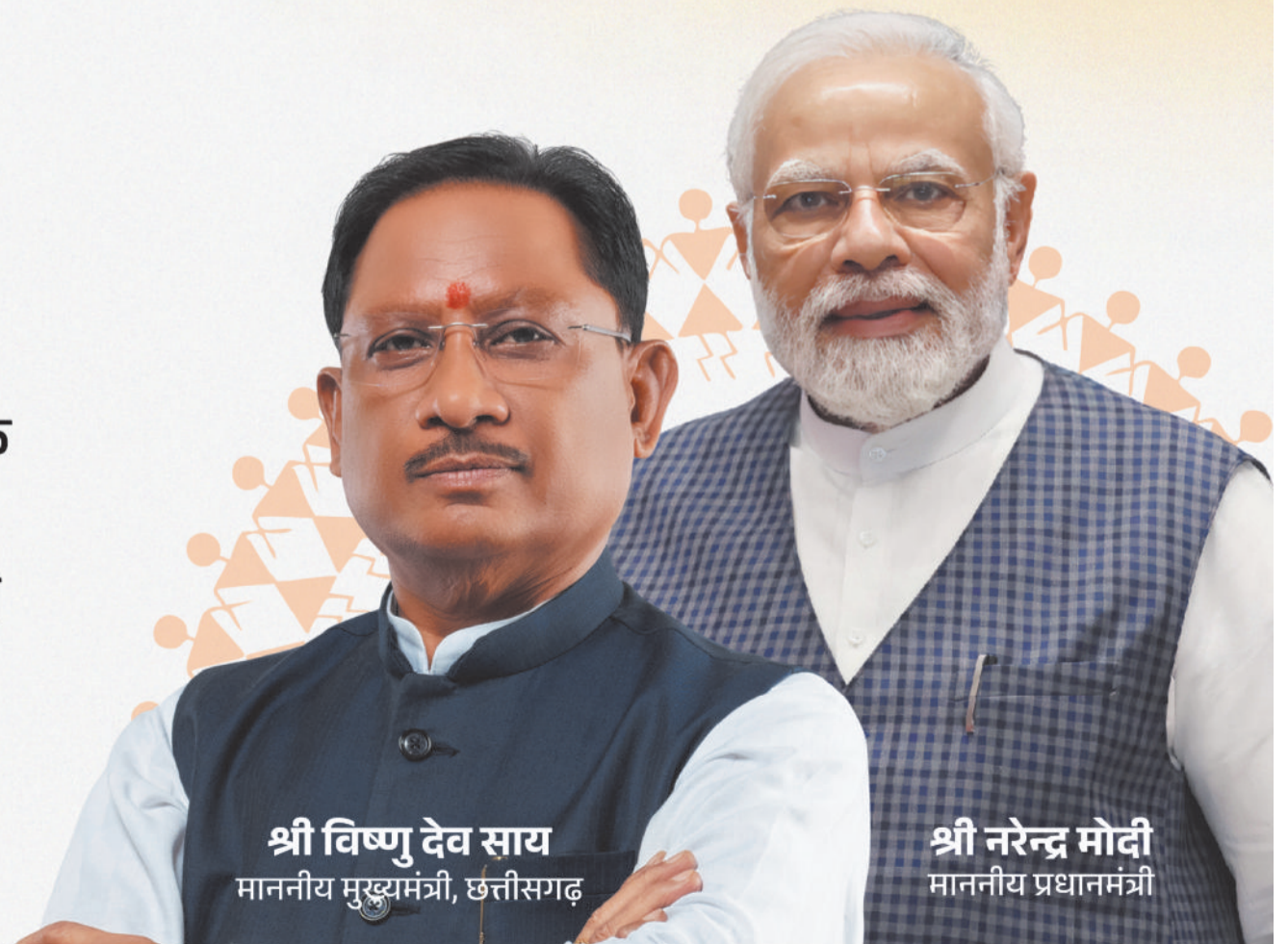
श्री विष्णु देव साय माननीय मुख्यमंत्री, छत्तीसगढ़