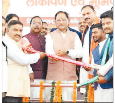
लोकार्पण एवं भूमिपूजन

मुख्यमंत्री विष्णु देव साय सोमवार को मन्नादा-चिरमिरी-भरतपुर जिले के पोड़ी में आयोजित विकास कार्यों के लोकार्पण एवं भूमिपूजन कार्यक्रम में शामिल हुए। इस अवसर पर उन्होंने क्षेत्रवासियों को बड़ी सीमागत देते हुए 88 करोड़ से अधिक की लागत के 59 विकास कार्यों का भूमिपूजन तथा 38 करोड़ से अधिक की लागत के 82 विकास कार्यों का लोकार्पण किया। मुख्यमंत्री श्री साय ने कहा कि इन विकास