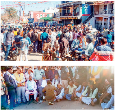
किया गया है गिरफ्तार